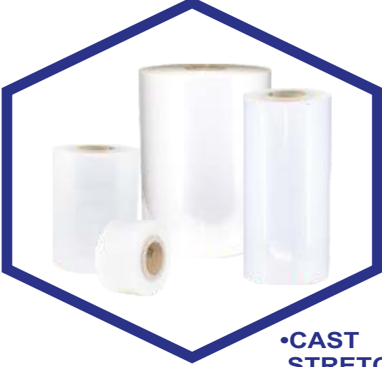
•CAST STRETCH FILM