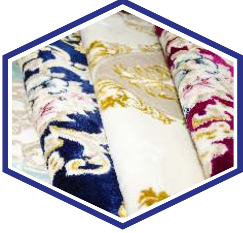
•HALI / CARPET