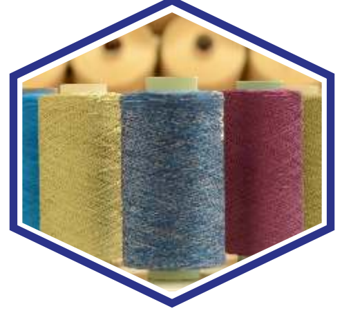
•PP,BCF HALI İPLİĞİ

Adres : 2.Organize Sanayi Bölgesi Celal Doğan Bulvarı No:2 27500 Başpınar /GAZİANTEP/TURKEY