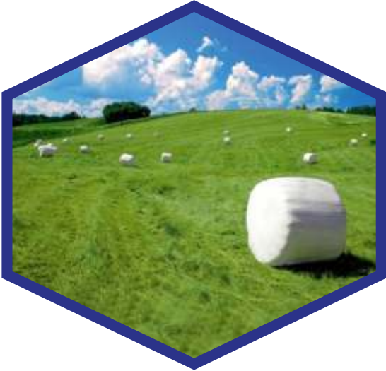
•SILAGE STRETCH / SİLAJ STREÇ